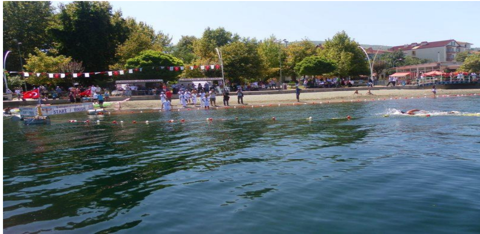
Değirmendere Gölcük 04 Ağustos 2018 Cumartesi

Program : 08:00 : Değirmendere Çınarlık Meydanı Sahili Toplanma 08:30 – 09:15 : 3000 m Yaş Gruplarının (Bayan-Erkek) Numaralandırılması 09:45 : 3000 m Yaş Gruplarının (Bayan-Erkek) Startı 10:00 – 10:30 : 1500 m Yaş Gruplarının (Bayan-Erkek) Numaralandırılması 11:00 : 1500 m Yaş Gruplarının (Bayan-Erkek) Startı 12:30 – 13:00 : Ödül Töreni ve Seremoni