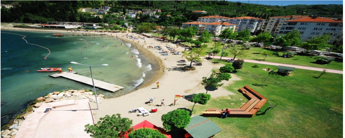
Karamürsel Altın Kemer 12 Ağustos 2018 Pazar

Web Adresleri : www.kocaeli.bel.tr www.karamursel.bel.tr